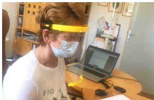
Zaščitno opremo je najbolj potrebovalo zdravniško osebje.